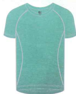
運動機能衫 市價：1880元