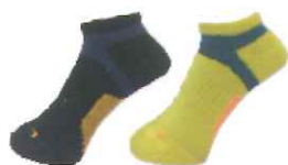
機能性抗菌運動襪 市價：299元 隨機出貨