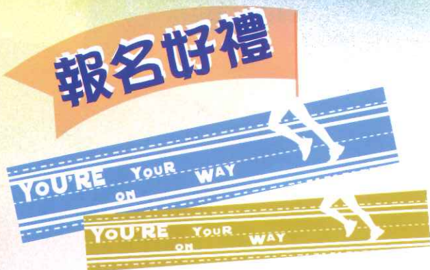
美國棉運動巾 市價：350元 隨機出貨