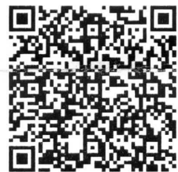
掃描我，取得會場 交通資訊