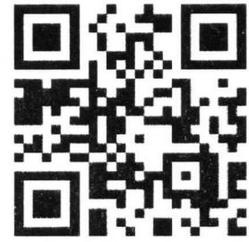
活動報名 QR code

步驟3、完成匯款，請提供帳號後 5 碼 mail 至 2016tasm@gmail.com，即完成報名作業。